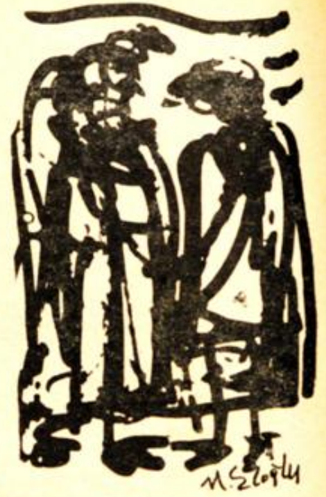
Desen : Metin Eloğlu

eremezler. Çünkü, birleştirici olmaktan öte, dağıtıcıdır da ondan. En küçük bir fırsatta eleştiri sayrılığına kapılırlar, hiç mi hiç hoş görüleri yoktur. Eksiklik duygularını giderebilmek için, önüne gelene saldırırlar. Böylelerinin pek mutlu olduğunu göremedim. Pek ön yargı değil ama, göremedim, duymadım, okumadım. Kimileri, isteklerini kısa sürede elde ederler, atak, aceleci olduklarından. Ama çok çabuk da bıkip usanırlar. Biraz da eleştirilme korkusundan doğar, bu ataklıkları. Çok sabırlı, çok hoşgörür insanın bile böyleleriyle kavga etmemesi için kadındaki özellikleri, onda az bulunsun, bulunmasın pek önemli değil, incelikle, tatlı bir dille anlatması gerekir. Açıkçası erkek, sürelî olarak, kendisini pohpohlarsa o erkeği belki sürelî olarak sevebilirler. Aslında her kadın biraz,