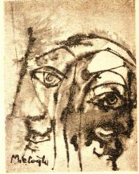
Desen : Metin Eloğlu

Çaltı dikenini sankim ayağındaki Sek sek gider, Dıkılmış da çöker başına Pis bir evren. Yükü boyunu aşkın Taşır "ıh" demeden.