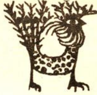
Desen : Özden Peker