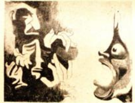
Resim: Senye Fenmen

18 yapıtıyla gerçekten başarılı bir çalışma topladı. Hele, Picasso'yu, Bon-