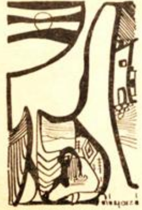
Desen : M. Niyazi Bayraktar

— Karıcığım, akşama misafilerimiz var. Çok eski bir dostum, aynı zamanda çok da severim kendisini. Uzun yıllar var ki birbirimizi görmemiştik. Dün eve gelirken yolda rastladım. Sarıldık, öpüştük. Ayaküstü eski günleri konuştuk. Evlenmiş. Bir de çocuğu olmuş, erkek. "Sorma, bir zeki, bir zeki ki, cin gibi!" diyor. Akşama davet ettim. Yemeğe gelecekler. Ona göre öteberiyi tedarik et, iyi bir yemek yap.