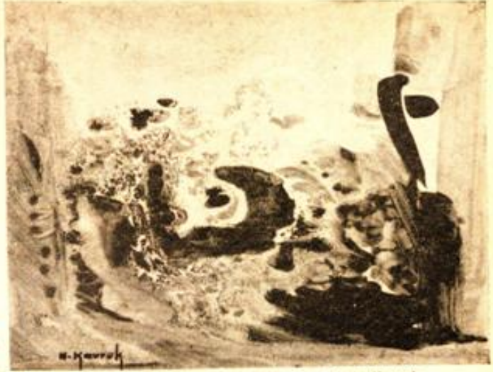
Desen : Hasan Kavruk