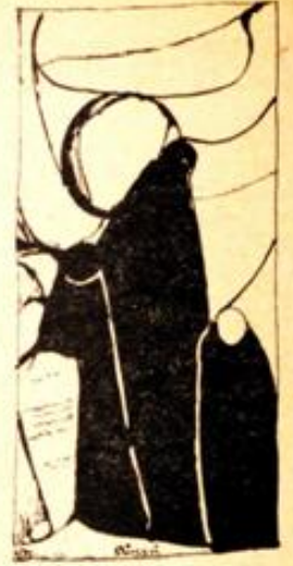
Desen : Niyazi Baysan

Memmed Ağa. Alnında boncuklanan terler, tozlu yüzünde izler bırakarak, çenesine doğru inmeye başladı. Çocukluğunda emmi oğlunun kamışla yaraladığı sol yanağı kıpır kıpır oynamağa başladı.