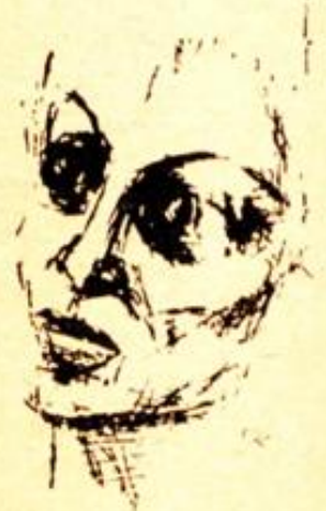
Fikret Ürgüp'ün çizgileriyle. Leylâ Erbil