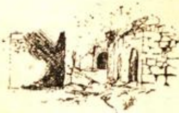
Desen : Mehmet Demirel

Gene de hak veriyorum sana. Dışardan bakıldığında çok şey yitireceksin elbet, Berlin'i, sevdiğin işini, hemen hemen üzüntü-süz sürdürdüğün yaşamını, kendine özgü,