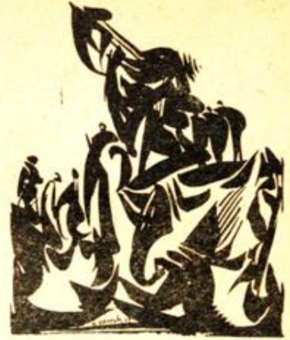
Desen : Hasan Kavrak