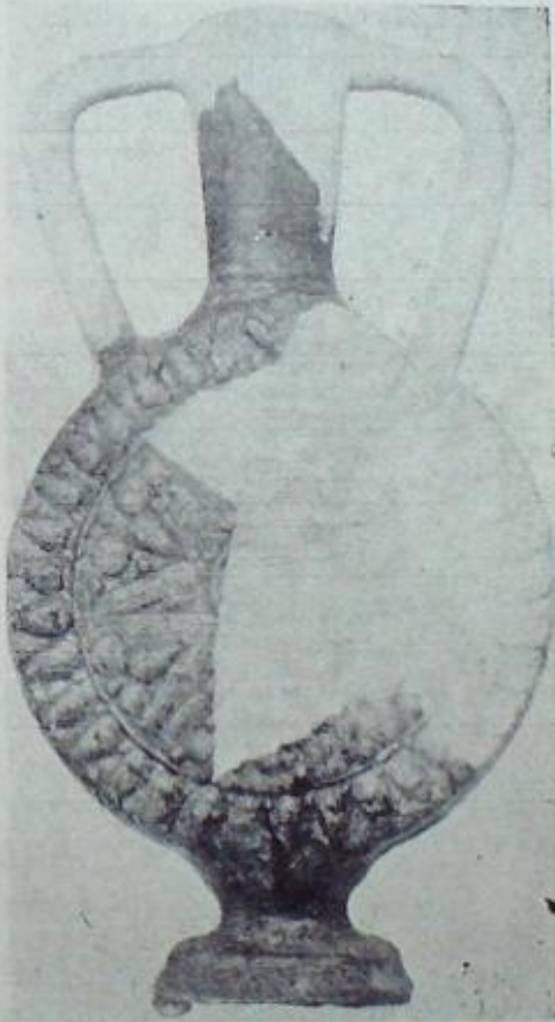
Resim (No. 1)

Tetkikimiz, Müslüman devrinden ve bilhassa yedinci asırda Arap istilâsından, onuncu asırda Bizanslıların avdetine kadar geçen zamanı kaplar.