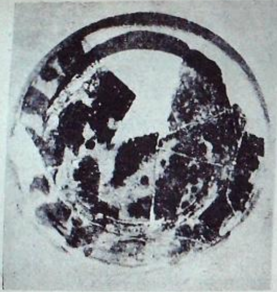
Resim (No. 2)

Bununla beraber arařtırmalarda, 8 nci asrın ilk yarısına ait Emevî paraları hattâ toprak kandilleri ve Emevî testileri bulunmuřtur. Bu da kat'i olarak ispat eder ki siyasi bir ehemmiyet taşıyacak kadar kalabalık olmasa da, 8 nci asrın ilk yarısında, Tarsusta bir müslüman mahallesi mevcuttu.