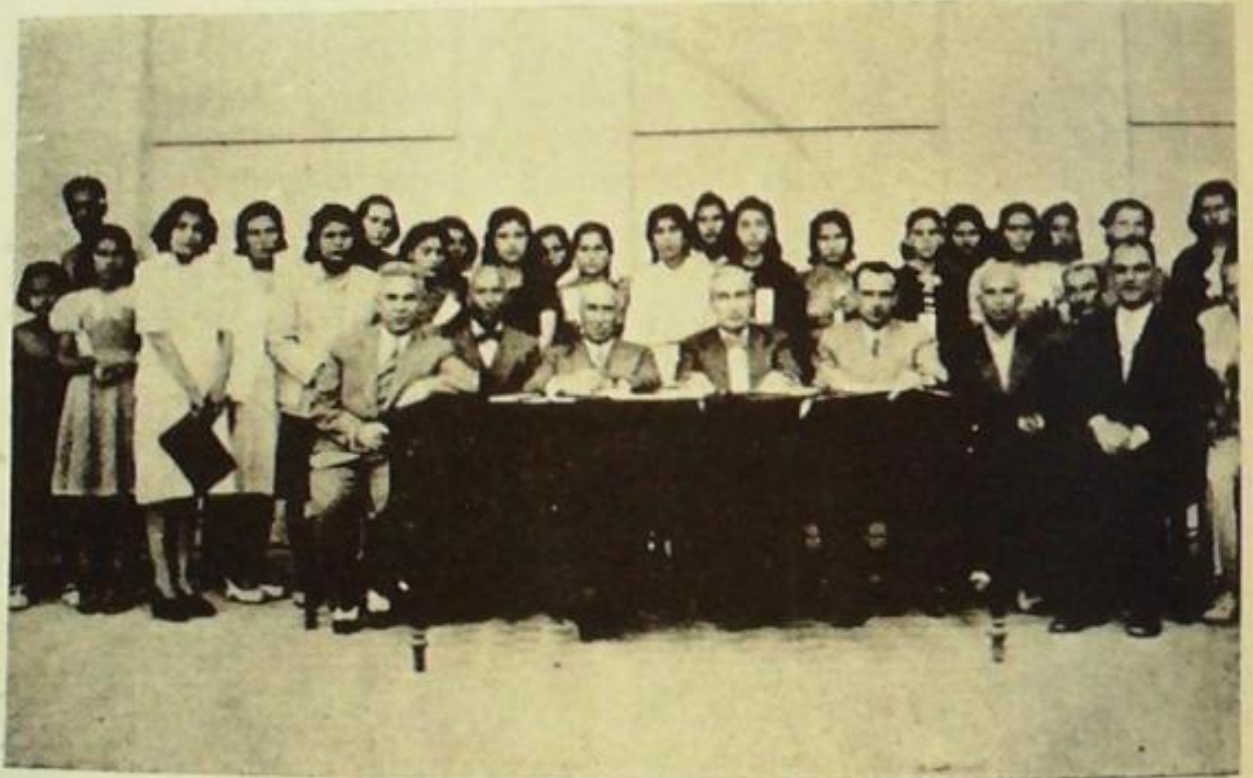
ÜSTTE: Evimiz Daktilo Kursu Çalışma Anında,