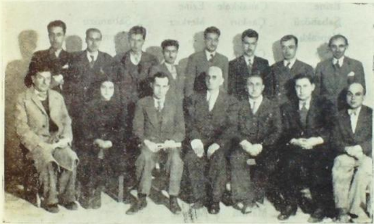
Üstteki resim : Halkevinin üç ay süren Muhasebe kursu talebeleri dershanede. Alttaki resim : Muhasebe kursu talebeleri imtihandan sonra öğretmen ve mümeyyizleriyle beraber.