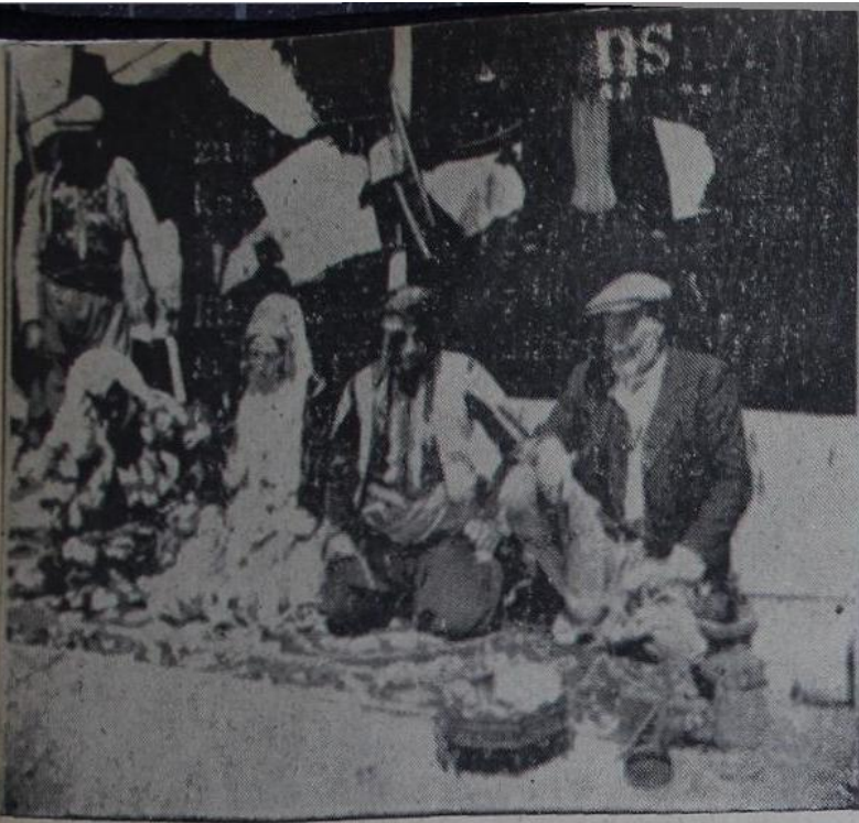
Kara çadır önünde bir düğün töreni