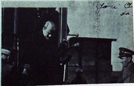
Atatürk 931 ziyaretinde trenden inerken

19 Teşrinisani 1937 sabaha karşı saat 2,45 te-Büyük Şef