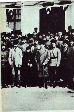
Tümkomutanlık Önünde.. 1923

ısnnda yirmi devletin demir zırhlılarını, zırhlı ordularını sularımızda topraklarımızda gördük, Türkiyenin mirasına gelen bu muhterisler Türklerin canevine gelmişlerdi. Bir taraftan güzel Seyhan kana boyanıyordu. Diğer taraftan güzel İzmir yakılıyor, İstanbul, Edirnenin üzerinden geçen bir ateş, bir alev Anadolunun her tarafını sarıyordu, Sultan denilen bir şerir saltanatları uğrun-da asırlardanberi kan döken milletini boğmak için Yunan ordularına yarış edecek kadar alçalıyor. Hain bir hükümet yabancıların hazinesine avuç açmış, bir Türk milletinin namusunu satıyordu.