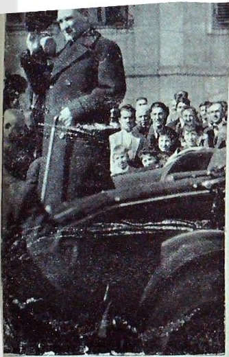
Atatürk 931 ziyaretinde Hükümet konağında çıktıktan sonra

öğleden sonra Kumluk meydanında yapılan makine ve traktör tecrübelerini görmüşler ve cirit oyununu seyretmişlerdir. Akşam da Türk ocağının şereflerine hazırladıkları müsamere de hazır bulunmuşlardır. Üçüncü gün memleket hastanesini ve bazı müesseseleri ziyaret etmişler ve Ocak sinemasında film ve beşkânunسانی Adana kurtuluş tablosunu seyretmişlerdir.