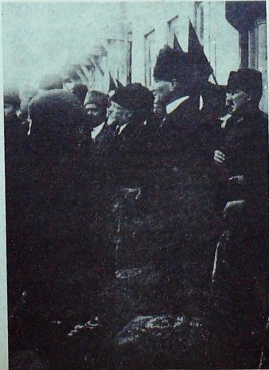
Atatürk Sultanide izelerinin yemin merasiminde bulunurken

İkinci gün ayaklarından hafifce rahatsız bulunan Büyük Misafir öğleye kadar ikametkâhlarında istirahat buyurmuşlar