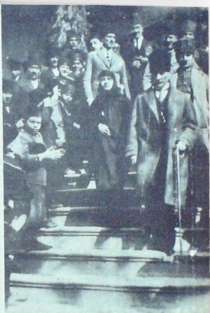
1923 Ziyaretinde : " Sultani .. binasından çıkarken « Şimdiki kız lisesi »

Kurtuluştan sonra Atatürk'ün Adanayı ilk defa şeref- lendirdiği günün, yani 15 martın, Halkevi tarafından tesid edileceğini ve evin çıkardığı « Görüşler » mecmuasının o gün baştan başa Ebedi Şefe ait hatıralara tahsis edileceğini bildiren mektubunuza çok sevdim. Yalnız bu mektubunuzda mecmua için benden de yazı istemeniz karşısında o sevince biraz dü- şünce karıştı : Atatürk için her bildiğimi, her müşahede ve hatıramı muhtelif vesilelerle yazmışım, artık ne yazabilirim ?