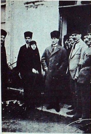
Atatürk, 1923'deki ziyareti esnasında Türkocağının önünde

Bir halk; muzafferini ancak bu kadar büyük bir coşuşla, bu kadar büyük bir sevgi ile bağrına basabilir. Onun ayaklarına kapananların; ömürlerinde hiç bir zaman bu derece heyecan ve saffetle, hiç bir şeyin önünde eğilmemiş oldukları görülmüyordu.