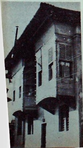
Yattığı Suphi Paşa Evi

Adanalıların bugünkü sevinciyle mukayese edilecek hiç