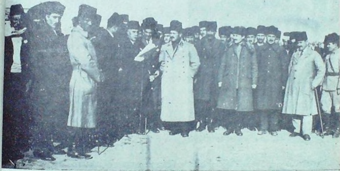
5 Kânunusani 925 Atatürkün Adana Hemşeriliğini kabul mazbatasının Belediye Reisi tarafından imza edilme resmi

bir mes'ud hâdise tasavvur edilemez. Buna benzer mes'ud bir gün dünyada daha yaşanılmamıştır denebilir.