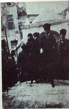
Atatürk Sultani mektebine (şimdiki Kız lisesine) girerken — 923

akşam Suphi Paşanın evinde (Ticaret mektebi) misafir ediliyor. Refikasını ayrı olarak Avni Paşanın evinde misafir etmek isteyen bir gurup hanımın arzusuna karşı :