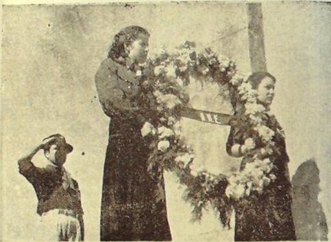
Atatürk Anıtına Çelenk konurken (20 Şubat)