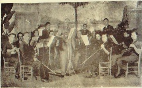
Altıncı yıldönümü onuruna konser (20 Şubat)

yacağı barizdir. Ve hele duygu itibarile bizi okşyamıyacak nağmeler olursa büsbütün dinliyenleri de, çalar-ları da hazin vaziyete düşürür.