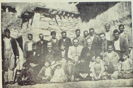
Hars Komitesi İsmailiye köylüleri arasında