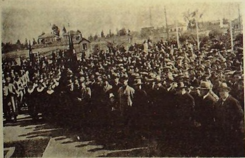
Atatürk Anıtı önünde Raşid Binözün nutku dinlenirken (20 Şubat)