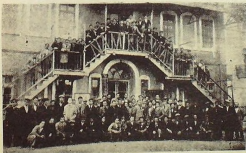
Motör Kursunun son günü (20 Şubat)