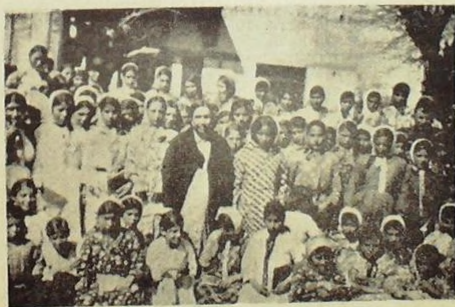
Akkapı Kadın Ulus Okulu talebeleri öğretmenleriyle birlikte