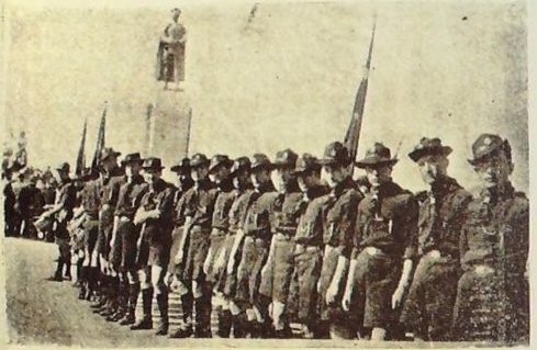
İzciler Atatürk anıtında (20 Şubat)

Onları bir pala gibi kullandın, Çünkü sen ölsen de kudrettin, candın : Senin cesedinde herkes can buldu, Tufegi elinde, bir aslan buldu. Senin büyüklüğün karşısındayız, Bir keskin kılıcız, fakat kındayız. Eğer kınımızdan bir sıyrılırsak O mağrur göğsünü bize ger de bak, Bak ki bizde böyle bin Dumlupınar Yaratacak kuvvet, kabiliyet var. Her kalpte o ateş yanyor sanki., Ey Mehmet, ey Mehmet bize inan ki Bir acı ses eğer duysak Vatandan Tekrar âbideler yaparız kandan.