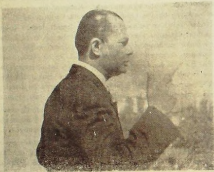
Raşid Binöz Atatürk Anıtı önünde nutuk söylerken (20 Şubat)