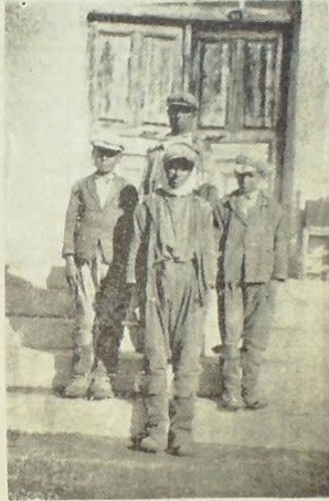
Karataş Eti Ulus Okulunda okuyan sığırtmaçlar