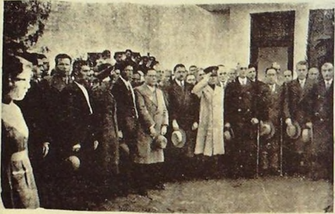
Yıldönümü günü Halkevi önünde istiklâl marşı dinlenirken

artırır. Ve insanı bilgilendirir. Okunan izer konuya göre insan ruhunda hüzün, neşe, hayret, sulh ve sükün, teselli, ümit gibi haletler meydana getirir. İnsana düşünmek hissetmek, hüküm ve muhakemede bulunmak, hislerini ifade edebilmek kabiliyetlerini kazandırır. Düşünmesini ve konuşmasını bilmemenin en büyük sebebi okumamaktır. Okumuş olmak için okumak, günlerce aç kalan bir insanın yalnız midesini doldurmak maksadile rasgele gıdayı büyük bir aç gözlülükle yemesine benzer.