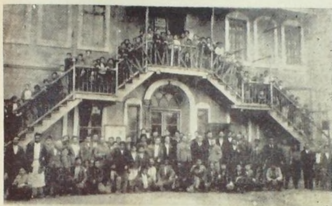
Dersaneler Kursunun son günü (20 Şubat)