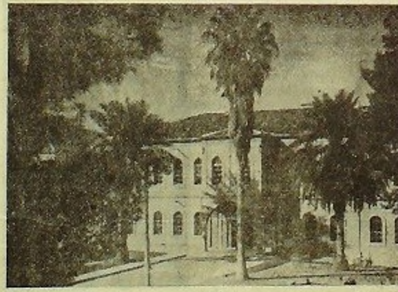
Kurtuluş günü şanlı bayrağımızın çekildiği