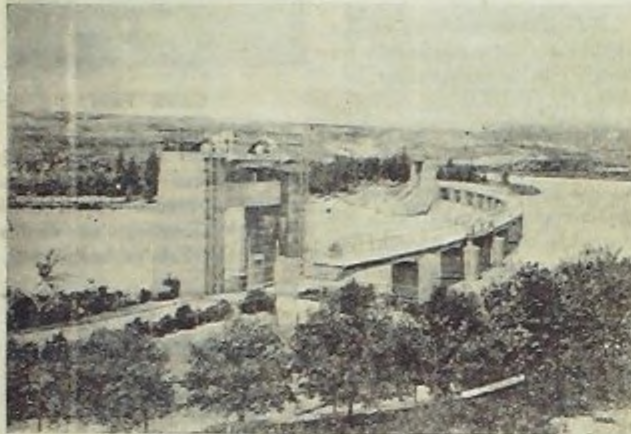
Tarsus Barajının umumi görünüşü

Kemalist Türkiye'sinin genç nesillerini yetiştirmek ve onlara bu duyguyu bîhakkin vermek de münevver ve öğretmenlerimize düşen millî bir vazifedir. Fikri Vutlu